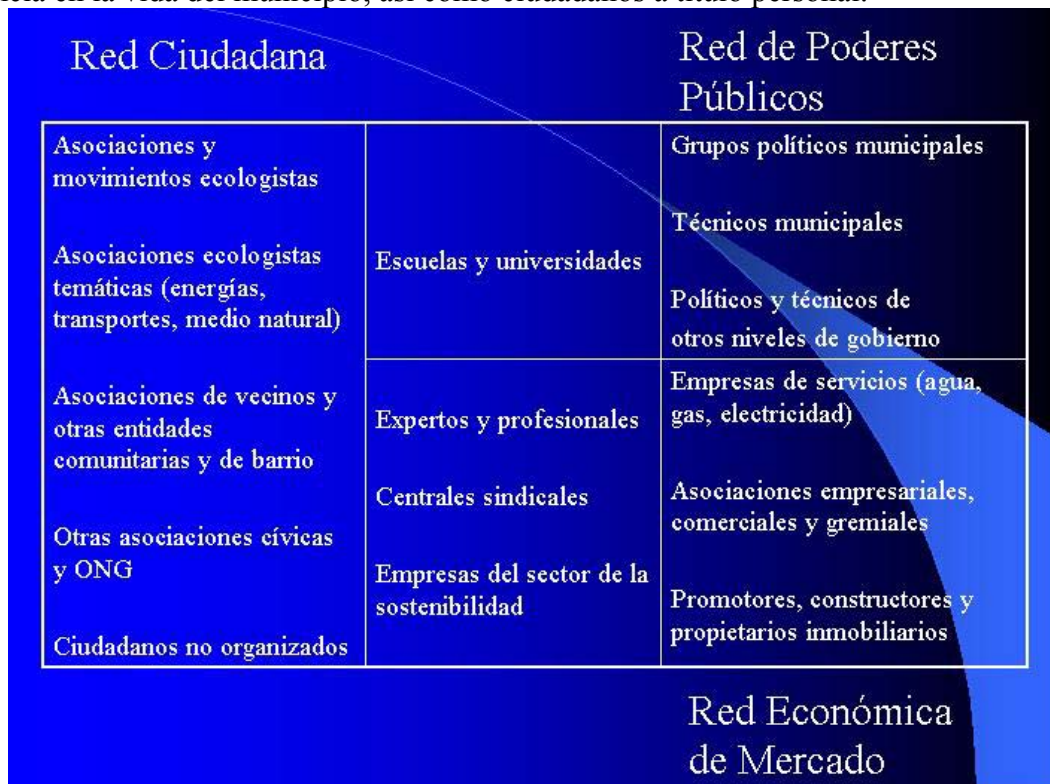
Red de actores para la sostenibilidad

Una vez movilizadas las bases sociales e institucionales, el paso seguido es la constitución del Foro Ambiental , un grupo de trabajo especial en el que participa el máximo número de interesados, en donde se expresan opiniones, debaten principios, comparten visiones, e intercambian y divulgan información. El organismo recibe también el nombre de Comité Ciudadano o Asamblea Verde y está compuesto por todas las instituciones y entidades con incidencia en la vida del municipio, así como ciudadanos a título personal.